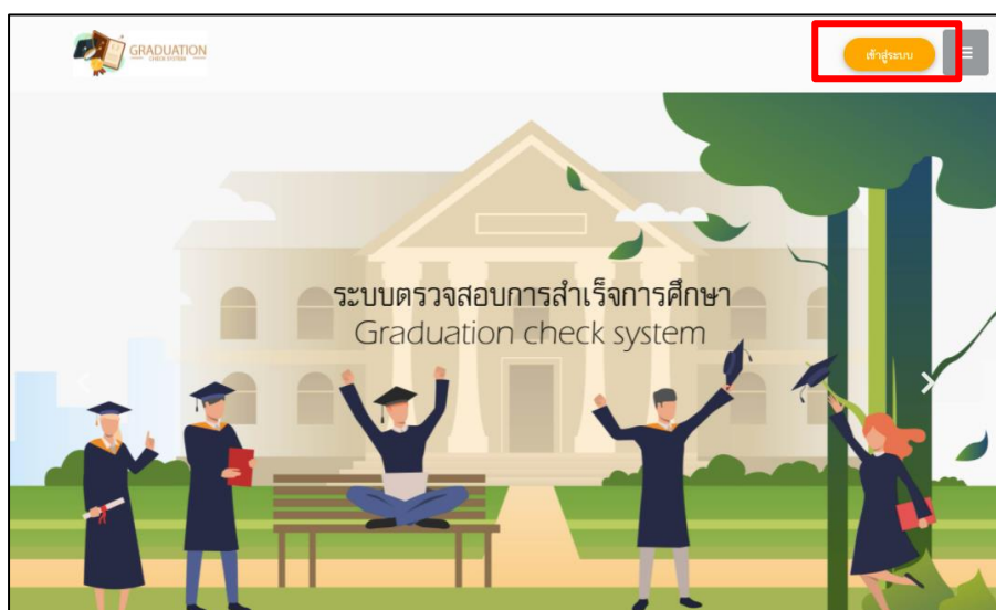
ภาพที่ 1 หน้าแรกของเว็บไซต์ http://gcs.lbtech.ac.th

ให้นักเรียนนักศึกษาเข้าระบบตรวจสอบการสำเร็จการศึกษา (Graduation Check System) ของวิทยาลัยเทคนิคลพบุรี ผ่านช่องทางเว็บไซต์ http://gcs.lbtech.ac.th เพื่อดาว์โหลดเอกสารแบบคำร้องขอจบการศึกษาปีการศึกษา 2564 กรอกข้อมูลในส่วนที่เกี่ยวข้อง และติดตามสถานะการขอจบการศึกษาของตนเอง