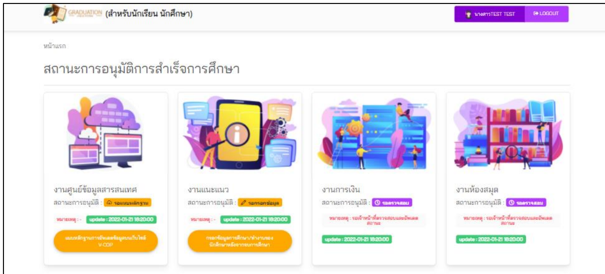
ภาพที่ 2 หน้าหลักของนักเรียนนักศึกษาในเว็บไซต์ http://gcs.lbtech.ac.th

1.1 งานศูนย์ข้อมูลสารสนเทศ ให้นักเรียนนักศึกษา แนบไฟล์รูปภาพ 3 รูป ได้แก่ ภาพหน้าจอข้อมูลส่วนตัว ภาพข้อมูลเกี่ยวกับความต้องการมีงานทำ และภาพข้อมูลสำหรับที่อยู่การติดต่อจากเว็บไซต์ศูนย์เครือข่ายกำลังคนอาชีวศึกษาให้เป็นปัจจุบัน (เว็บไซต์ https://v-cop.go.th )